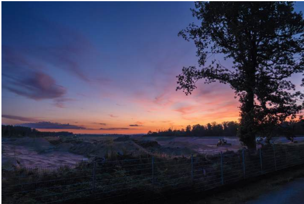
Foto: Sehring-Krater im Sonnenuntergang