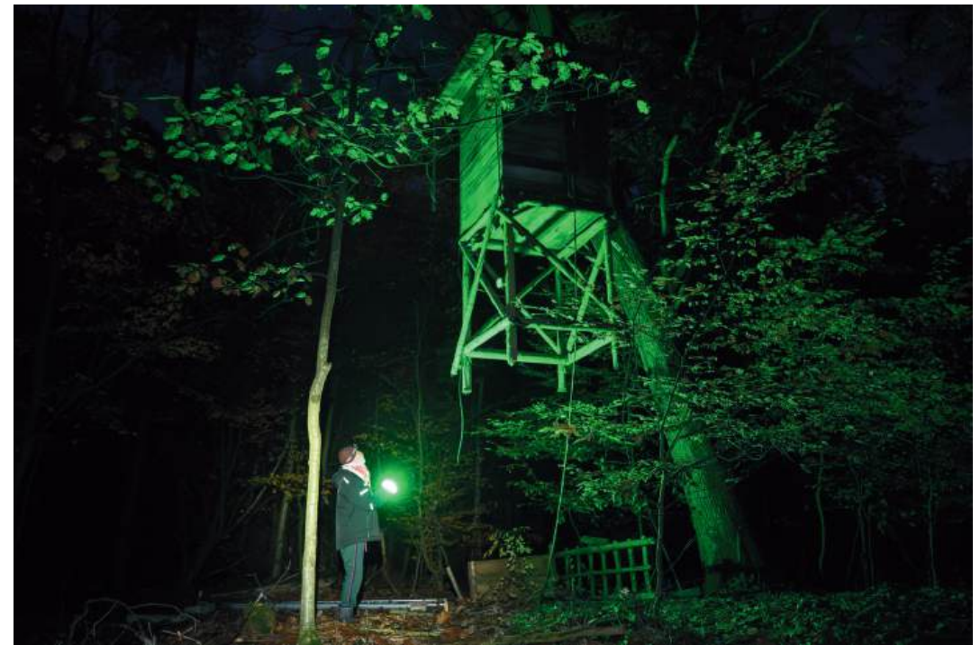
hochgezogener Jägerstand / Trinkwasser Transport

Früher am Tag Hoch über den Bäumen Mag die Freiheit... Sorry... Sorry... Ich schwanke am Mast in einer leichten Brise Die Sonne fällt auf wehende Wipfel Die Linie des Taunus, ein Segelschiff auf einem See, ein Paar Flugzeuge, die Skyline, ganz klein Mein Gesicht ist leicht betäubt, meine Augen weit aufgerissen, ich fühle mich wie kurz vorm weinen, sehr wach und verbraucht zugleich