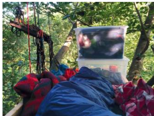
Foto: erste Nacht auf Luftschloss

Abends singt die Gitarristin 'the trees can't be harmed, when the lorax is armed' Mensch erzählt, wie Mensch mal aus Versehen den Garten des Königs besetzt hat Mensch wird Terrorismus vorgeworfen, hmm, ja, passiert Mensch redet erst wie immer nicht, dann ein Flachwitz über einen Wels in Wales aus dem nichts Wenn es regnet atmet der Wald auf Irgendetwas löst sich, ist Wasserlöslich