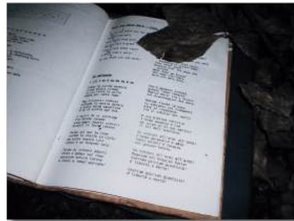
Foto: italienisches Partisanenlied - Il Galeone

Spaß Fick deine Utopie Das hier ist Krieg Gegen den Anstand Aber auch gegen Punk Gegen saubere Höflichkeit Gegen aufdringliche Sauberkeit Eine Revolution der Mäuse Der Diebe und Musikanten Kaninchen und Bäume Der vor langer Zeit Verbannten Eine Flucht Vor den Beamten Die Polizei kennt mich besser als du