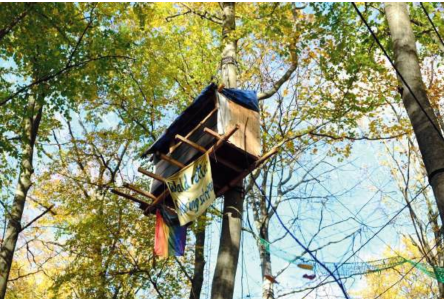
Foto: Baumhaus Betriebsgelände