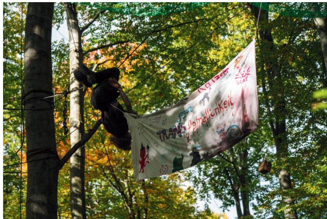
non-binärer Zirkus / Abkühlung an der Spülstraße