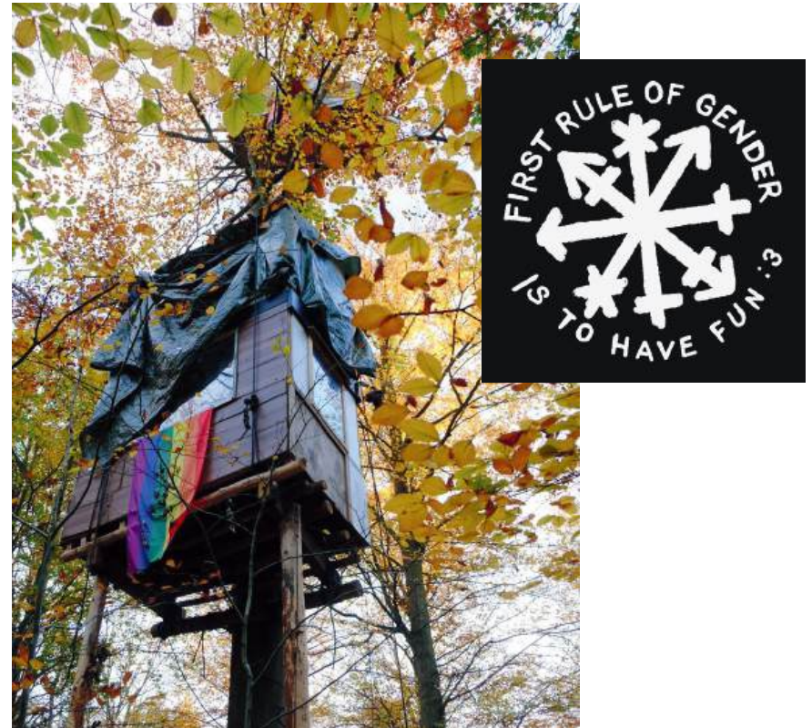
Foto: Baumhaus Zugbrücke, oben versteckt Luftschloss

(Geschrieben von einer transfem, die sich nach wie vor binär weiblich identifiziert.) (Übrigens ist dieses Toilettenschild fürn Arsch: Die Geschlechtertrennung gibt es wirklich fast überall, aber nicht alles ist automatisch eine Toilette. Dieses Schild bitte abschaffen, es ist für seinen Zweck nicht geeignet!)