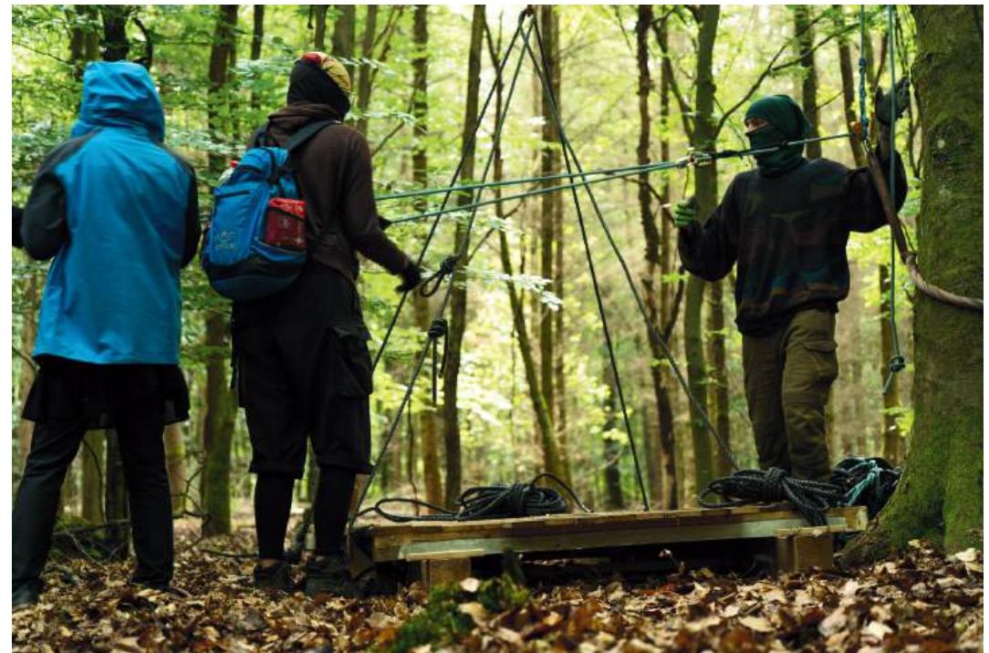
Der Widerstand geht weiter - Neubesetzung des Bannys im Mai 2026

Wo einst ein Raum für Wesen aller Art war, klafft bald ein riesiges Loch mit einer laut piependen Maschine drin. Dass der Wald dadurch weiter austrocknet, die Waldbrandgefahr steigt und die Klimakrise dadurch noch markanter verschlimmert wird, will man dann fast gar nicht mehr wissen. Doch die Sidefacts, wie furchtbar Sehring und die Zerstörung dieses Waldes eigentlich sind, enden da noch lange nicht. Doch auch der Widerstand ist noch lange nicht vorbei, am 19.05.2026 wurde der Abschnitt 34 wieder neu besetzt!