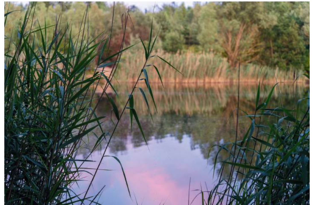
kleiner Naturwaldsee / High-Pods in der Abend Dämmerung

Fazit am Ende hast du zwei Menschen die viel zu lange im Gurt saßen und eine Einbindung die neugemacht werden muss :)